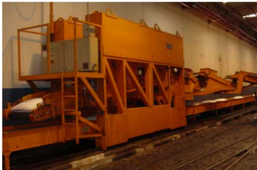
Figura 2. Porto de Santos, 2011. Esteira de sacos de açúcar. Pesagem automática. (5)

A automação portuária é fundamental para estimular cada vez mais as operações de comércio exterior, proporcionando a competitividade necessária para a inserção efetiva do país no mercado globalizado. Mais de 90% das exportações brasileiras são feitas por via marítima, uma vez que essa modalidade é a que apresenta maior capacidade de volume de cargas, se comparada à aérea e à terrestre. Trata-se, portanto, do mais abrangente e importante modo de transporte de mercadorias, responsável pelo maior número do total de transações comerciais entre os países. Nos últimos seis anos, a movimentação de contêineres no Brasil cresceu cerca de 350%. Um percentual que faz as autoridades governamentais ficarem atentas à modernização do setor e a formularem políticas para alcançar um controle maior sobre as mercadorias que entram e saem do país.