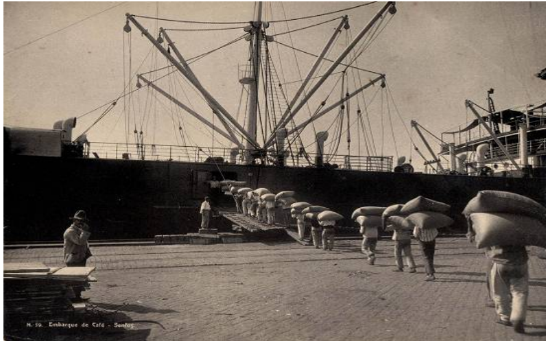
Figura 1. Estivadores trabalhando no porto de Santos, por volta do ano de 1900. (4)

Fazendo uma comparação entre as Figuras 1 e 2, tem-se uma demonstração do que significa automação portuária. A Figura 1 retrata o porto de Santos no início do século XX, apresenta uma sequência de estivadores carregando sacos de granel para o porão do navio. A Figura 2, cem anos depois, apresenta outro cenário. Pode ser observado um processo automatizado, utilizando-se esteiras automáticas para o envio das sacas de açúcar levando ao porão do navio.