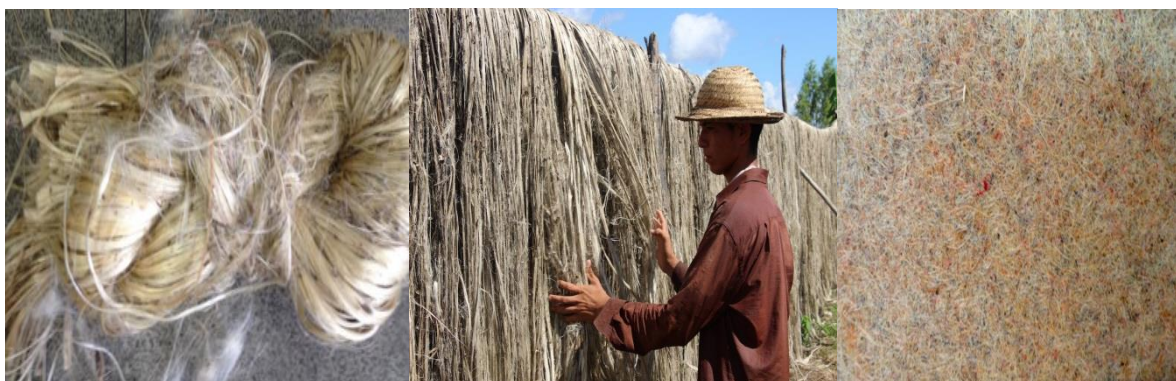
Figura 1. Fibras de (a)Malva, (b) Juta e (c) a manta híbrida de Malva e Juta.

Os materiais utilizados nesse trabalho foram a resina comercial epoxi DGEBA/TETA com phr13, proveniente da empresa Resinpoxy e a manta híbrida de Malva e Juta foi adquirida da empresa PERMANTEC. Na Fig.1 podemos ver as fibras de Malva (a) e de Juta (b) e a manta híbrida de Malva e Juta (c).