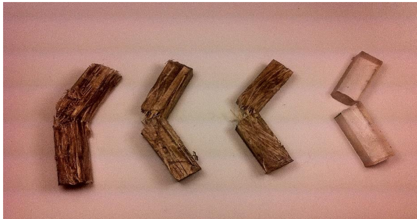
Figura 4. Macrografia das amostras de compósitos epoxy reforçados com manta de malva e juta.