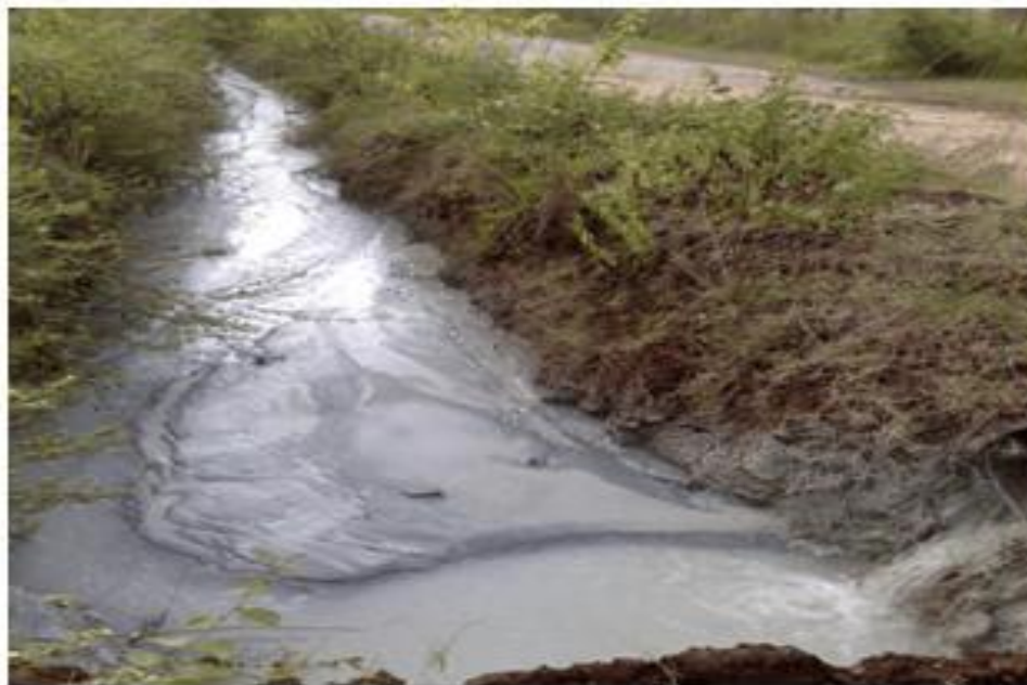
Figura 1: Resíduo de rochas ornamentais descartado de forma irregular

Esses resíduos podem trazer inúmeras consequências se descartado de forma irregular, como por exemplo causar assoreamento se atingir rios, contaminar solos e lençóis freáticos, como podemos ver na Figura 1, o resíduo descartado num córrego.