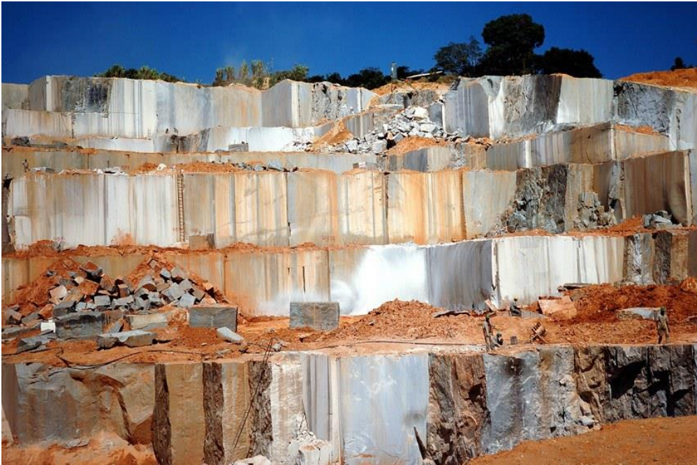
Figura 2: Parque de extração e beneficiamento de rochas em Cachoeiro

como podemos ver na Figura 2 um de seus parques industriais, como a geografia da cidade propiciou essa atividade: