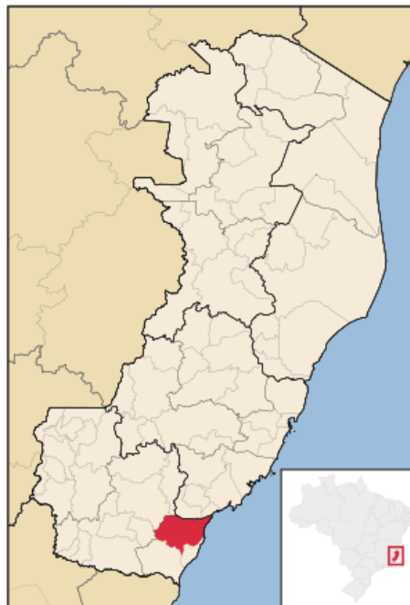
Figura 1. Localização do município de Itapemirim/ ES.

Hoje o estado do Espírito Santo conta com cerca de 40 empresas produtoras de cerâmica vermelha, revestimentos e porcelanas, que empregam hoje cerca de 3.500 pessoas, sendo uma atividade altamente geradora de recursos. Um dos grandes problemas relacionados ao processo produtivo no estado é o seu custo, no que tange ao energético e de transporte de material. Outro ponto é a sua proximidade do município de Campos dos Goytacazes – RJ, um dos maiores polos ceramistas do país, que acaba competindo de maneira direta com os produtos capixabas. O município de Itapemirim (Figura 1) tem se destacado no cenário produtivo estadual, sendo responsável pela presença de algumas indústrias cerâmicas [2 e 3].