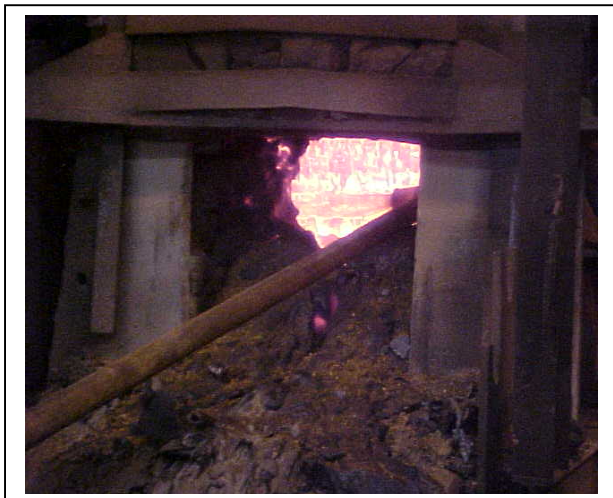
Figura 3 – projeção de massa