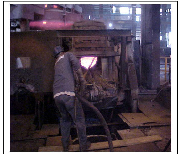
Figura 2 – projeção de massa