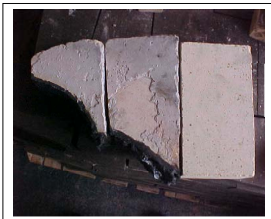
Figura 7 – desgaste dos tijolos refratários

Foi revista a condição para cuidar do resfriamento do forno depois que aciaria parasse para a manutenção semanal, controlando a umidade empregada, descartando qualquer adição de água em excesso em tijolos refratários que fossem aproveitados no reparo.