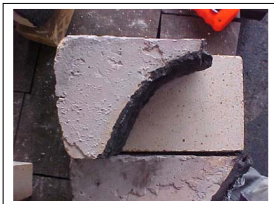
Figura 6 - Aspecto do tijolo desgastado em relação a um tijolo novo.

Houve um upgrade na sub-estação e mais opções de taps dos fornos, principalmente para o sentido de se ter maiores potências na esperança de reduzir o tap to tap das corridas que, para fundições, naturalmente se encontram em valores médios de 2,5 a 4 horas por corrida, já que geralmente não é usada a tecnologia do forno-panela. No caso das usinas siderúrgicas, o forno elétrico fica apenas para o derretimento da carga sólida quando, pois temos a alternativa do forno-panela; sendo assim, essas corridas são muito rápidas, levando menos de 1 hora. Nas fundições, praticamente todas as reações físico-químicas acontecem dentro do forno elétrico a arco, deixando para a panela apenas a desoxidação final e limpeza com argônio.