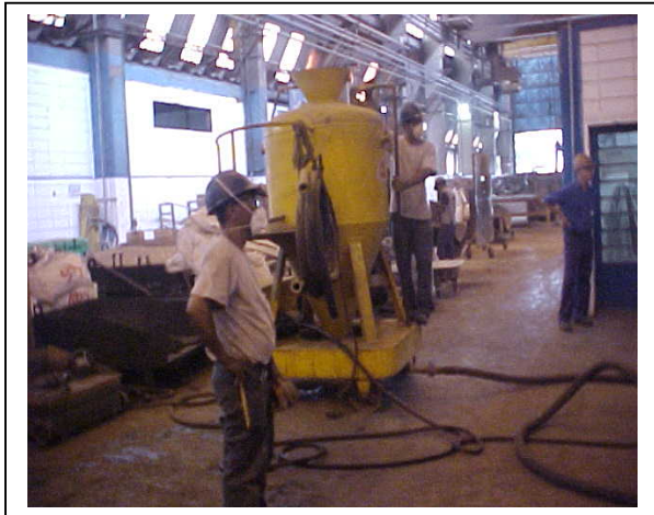
Figura 1 – máquina de projeção

Cabe lembrar que, apesar desse relatório estar direcionado para o problema de inclusões não metálicas devido à excessiva projeção de massa refratária durante a campanha normal na semana, ele leva à reflexão da forma de análise dos dados de forma mais interligada entre os vários setores envolvidos, desde o Planejamento até a Produção.