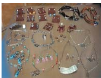
Figura 1. Bijouterias feitas durante a oficina.

Oficina de Bijouteria: Com o objetivo de fornecer aos participantes uma visão geral e aplicação do aço inox na confecção de bijouterias, o curso envolve pessoas maiores de 18 anos a descobrirem uma maneira diferente para se trabalhar com o inox. O curso ensina a confecção de anéis, brincos, gargantilhas, pulseiras, braceletes, arcos e cintos feitos com o material qualificando profissionalmente os participantes que pretendem adquirir conhecimentos e prática visando a geração de renda.