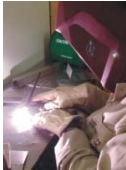
Figura 4. Treinamento do curso de Solda TIG

Soldagem Processo TIG Comunidade: No curso, jovens acima de 18 anos adquirem conhecimentos teórico e prático para execução de soldagens de chapas finas de aço inox, utilizando o processo de soldagem TIG. O treinamento capacita os participantes no desenvolvimento de atividades voltadas a soldagem de chapas e tubos de aço inoxidável, de diferentes espessuras.