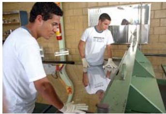
Figura 2. Participantes do curso Jovem Empreendedor cortando a chapa de inox.

Jovem empreendedor: Partindo do princípio de desenvolver o empreendedorismo nos jovens, o curso proporciona aos treinando conhecimentos básicos sobre o aço inox, suas propriedade, processos de conformação, soldagem, acabamento, cuidados com o manuseio e estocagem. Participam do curso jovens de 18 a 25 anos, que participaram do Projeto Aprender a Empreender, desenvolvido pela Fundação Acesita em parceria com a Associação Junior Achievement de Minas Gerais. Após a conclusão do curso os jovens executam um plano de negócio, escolhendo um produto e montando uma pequena firma.