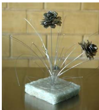
Figura 3. Peça feita pela artesã Wilma Vilches.

Trabalhabilidade do Aço Inox: Sendo um dos cursos mais requisitados, tanto pela comunidade quanto pelas empresas, o Trabalhabilidade do Aço Inox proporciona aos treinandos conhecimentos básicos sobre o aço inox. Além do estudo sobre suas propriedades, processo de conformação, soldagem, acabamento, cuidados no manuseio e estocagem. Também oferece aos participantes um conhecimento do fluxo da produção do aço inox. O curso é voltado para dois públicos: jovens de 18 a 25 anos que buscam o primeiro emprego e empregados da Acesita.