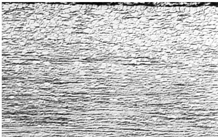
Figura 3: Microestrutura de bobina a quente de aço elétrico submetida a temperatura de acabamento de 845°C e bobinamento de 640°C. Ataque de Nital 3%, aumento de 250 x.

A tabela 1 mostra os resultados de ensaios de tração efetuados em amostras de aço elétrico extraídas nas duas bordas e no centro da largura da tira a quente. Os níveis de variação observados para os limites de escoamento e de resistência, alongamento total e dureza Rockwell B foram significativamente altos ao longo da largura em relação aos geralmente observados para aços ao C. Os valores de resistência mecânica e dureza foram maiores no lado operação correspondendo ainda, como já seria de se esperar, os menores valores de ductilidade. As significativas diferenças observadas entre as características mecânicas das duas bordas longitudinais do material pode ser atribuída ao grande intervalo de desenformamento observado entre a placa que deu origem à tira a quente aqui analisada e a anterior, que foi igual a 27 minutos. Isso certamente contribuiu um resfriamento mais intenso da borda longitudinal no lado operação da placa, uma vez que ela ficou exposta à infiltração do ar atmosférico pela porta de saída do forno de reaquecimento de placas ao longo de um período de tempo significativo. Essa menor temperatura de saída do forno deve ter contribuído para um maior refino microestrutural e uma conseqüente elevação da resistência mecânica nessa região, conforme mostrado pelos resultados do ensaio de tração.