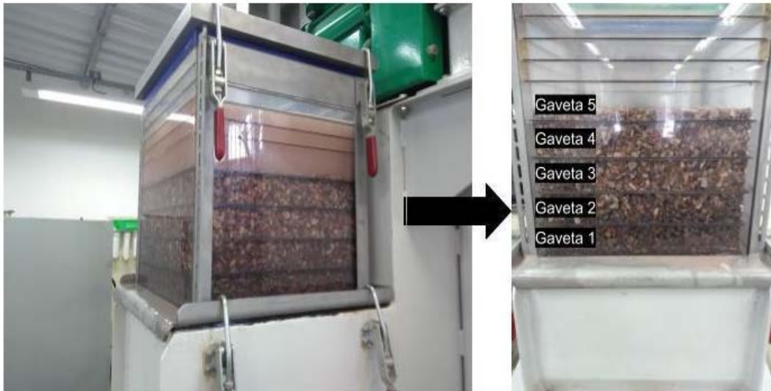
Figura 2. Jigue utilizado no programa de testes.

Em seguida, os estratos (gavetas) considerados como pré-concentrado foram britados até totalmente passantes em 1,18 mm e então homogeneizados com o bypass da jigagem em pilha alongada, da qual se retirou alíquotas de 857 gideais para as etapas seguintes de moagem e flotação. Para a amostra tal qual, também foi separado alíquotas de mesma massa com o material britado em 1,18 mm.