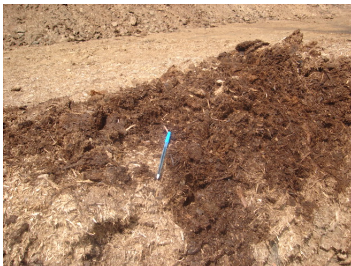
Figura 1 - Bagaço estocado exposto ao tempo.