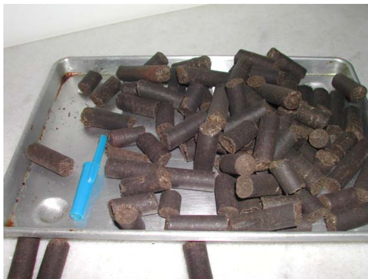
Figura 5 - Briquetes de bagaço de cana-de-açúcar

O resultado do ensaio de carbonização dos briquetes utilizando um forno de microondas não foi satisfatório visto que se tornou um material muito quebradiço, ou seja, inadequado para os fins a qual seria destinada, produção de gusa em altos-fornos. Além de ter havido em alguns casos a sua queima total. O que poderia acontecer, diante da atmosfera oxidante usada.