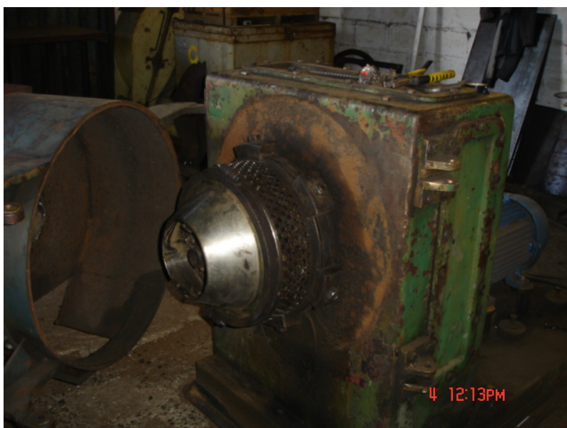
Figura 2 – Máquina usada para briquetar o bagaço de cana, em São Paulo.

Da análise da composição estrutural do bagaço de cana-de-açúcar, pode-se inferir que existe pequena possibilidade de se produzir carvão. Foi feito ensaio de carbonização dos briquetes utilizando um forno de microondas. Este ensaio foi realizado variando a quantidade do material e a intensidade do forno de microondas.