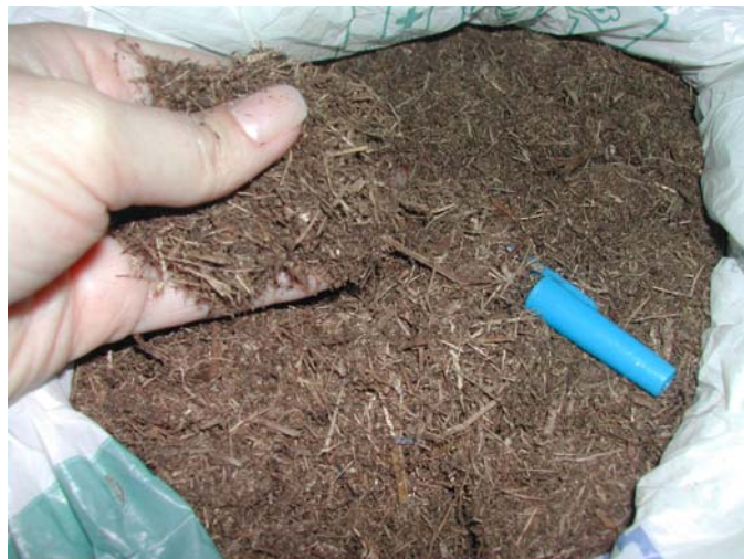
Figura 4 - Material retido na peneira de 2,83 mm

A Figura 4 mostra o material que ficou retido na peneira, ou seja, o material acima de 2,83 mm. Este material pode e deve ser cominuído, para um eventual processo de fabricação, visto que representa quase 30 % do material que lhe deu origem.