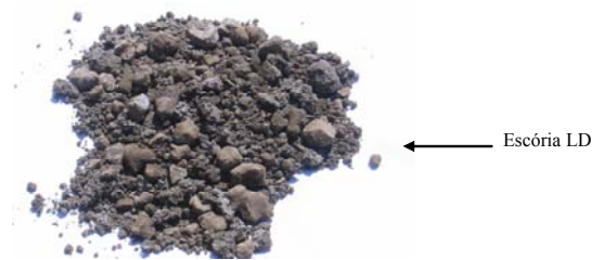
Figura 3. Amostra de Escória LD

5.1 A utilização da escória é benéfica ao meio ambiente na medida que pode substituir minerais cuja extração impacta o meio ambiente, ( brita, areia e calcário)