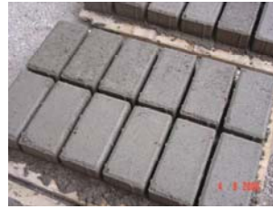
1º Lote de blocos de pavimentação para utilização na CST (agosto/06)