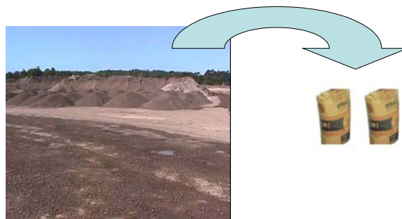
Figura 8. Aplicação de escória em cimento

5.5 A utilização de escória de 0 a 12 mm, na produção de cimento.