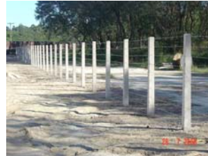
Exemplo de aplicação em mourões de escória Área do Virador de Vagões – CST (julho/06)

Em andamento estudo de acompanhamento pela Falcão Bauer