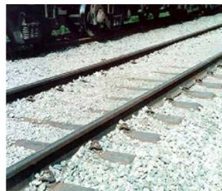
Figura 7. Exemplo de lastro ferroviário utilizando escória (via principal dentro da CST)

5.4 A utilização de escória com lastro ferroviário (granulometria de 32 a 75 mm), em substituição a brita.