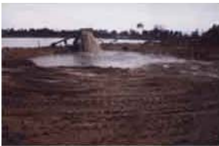
Extração de Areia

5.1 A utilização da escória é benéfica ao meio ambiente na medida que pode substituir minerais cuja extração impacta o meio ambiente, ( brita, areia e calcário)