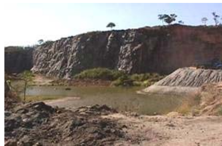
Exploração de Pedreiras