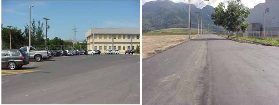
Estacionamento Fabril do LTQ- CST Rodovia Norte-Sul – Vitória

5.3 A utilização de escórias em pavimentações (granulometria de 0 a 19 mm ) como base e sub-base de estradas.