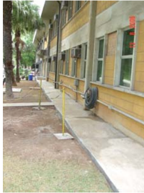
Exemplo de aplicação de escória em construção de passarelas de concreto (85 % de escória e 15% de cimento) (agosto/06)