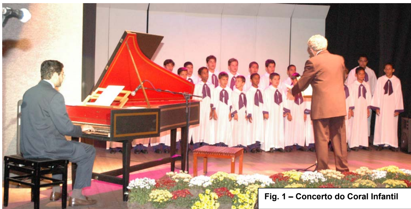
Fig. 1 – Concerto do Coral Infantil

Além de levar o canto-coral à comunidade de Timóteo, o Coro tem-se apresentado em outras cidades da região, como Coronel Fabriciano e Ipatinga, participando de eventos também em Belo Horizonte, Caratinga e Rio de Janeiro. Integrando as apresentações que constam de repertório variado, já se tornaram tradicionais as Cantatas de Natal, em Timóteo e outras cidades, incluindo a capital mineira.