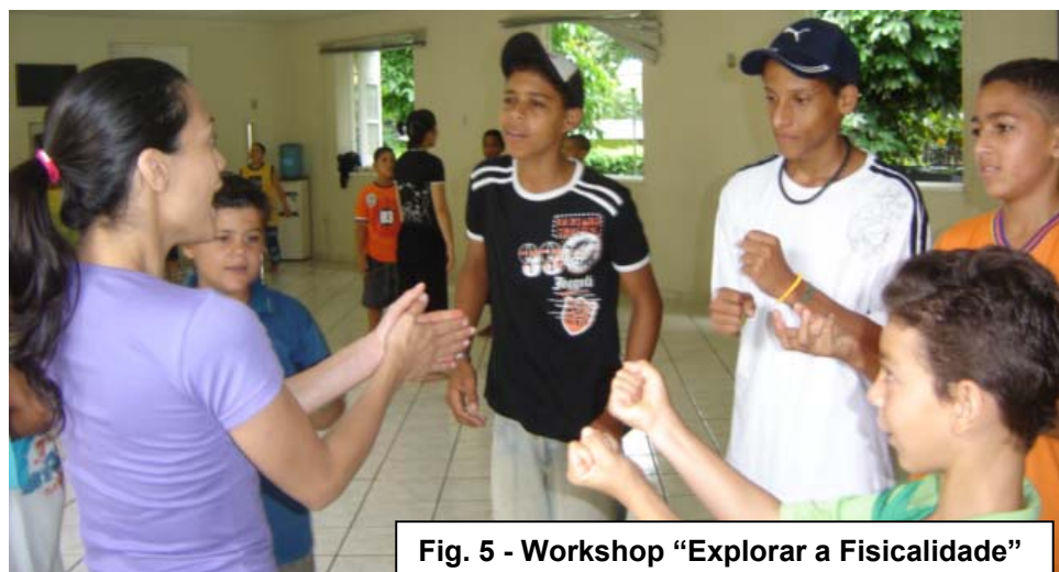
Fig. 5 - Workshop "Explorar a Fisicalidade"