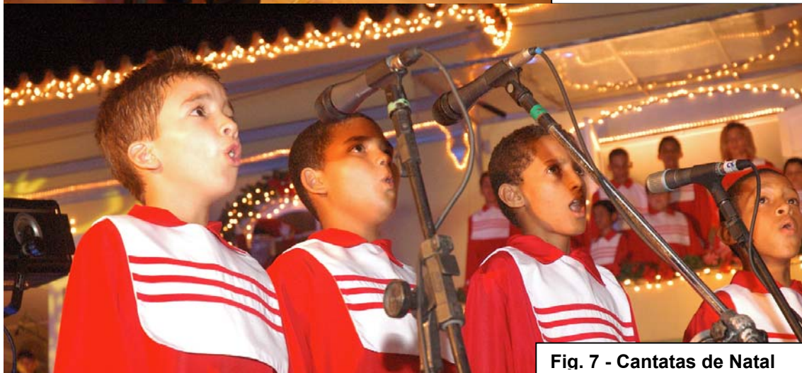
Fig. 7 - Cantatas de Natal