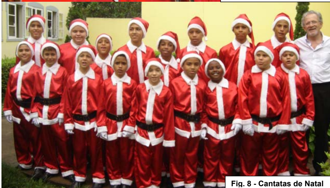
Fig. 8 - Cantatas de Natal