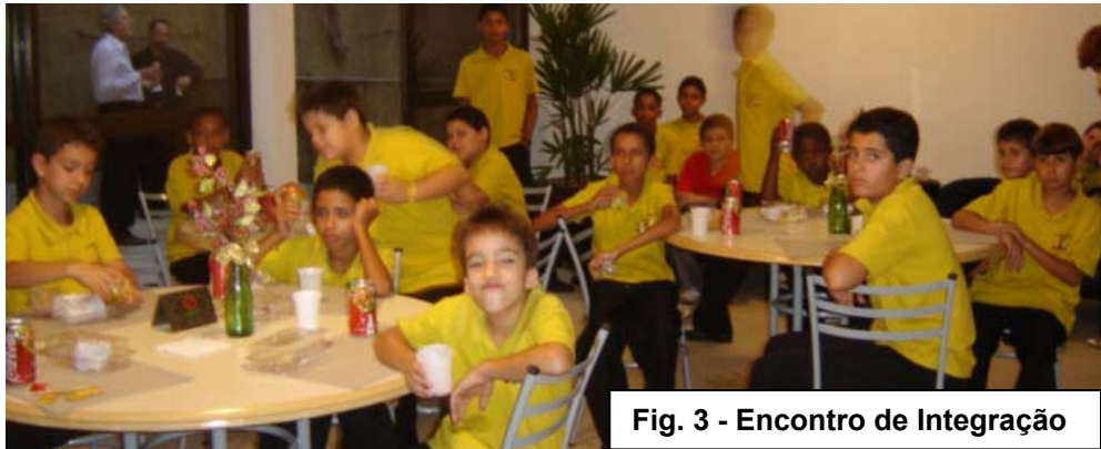
Fig. 3 - Encontro de Integração