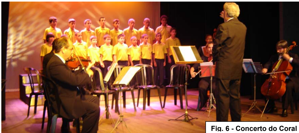
Fig. 6 - Concerto do Coral