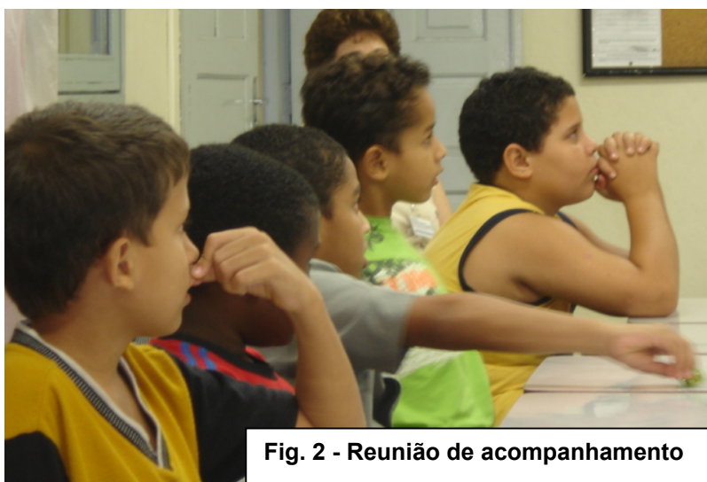
Fig. 2 - Reunião de acompanhamento