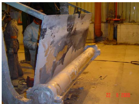
Figura 2. Rolo corretor com a instalação de placa de aço inoxidável para garantia da homogeneidade do banho.

Quando os lingotes são fundidos no pote de pré-fusão, ocorre a homogeneização da liga antes da transferência do metal fundido para o pote principal. Com a adição de lingotes de Al/Si e Zinco SHG à frente do pote principal, por onde ocorre a passagem da tira metálica, haveria a possibilidade de não ser atingida esta homogeneização, fato de suma importância uma vez que a resistência à corrosão do Galvalume ® está relacionada a composição química da liga. Para assegurar a homogeneidade da liga foi realizada a instalação de uma placa de aço inoxidável 316L (6mm de espessura) soldada diretamente na base do rolo corretor conforme mostrado na Fig. 2. Dessa forma, o metal fundido percorreria um caminho longo até atingir a chapa de aço e nesse caminho a liga se tornaria homogênea.