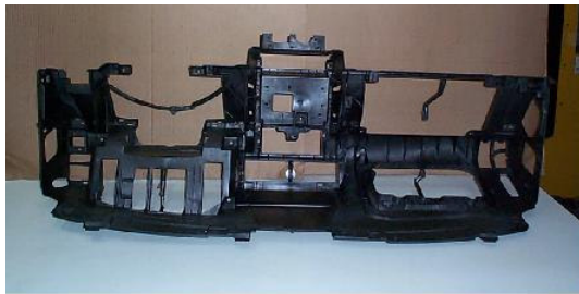
Figura 2 – Peça plástica: painel frontal.