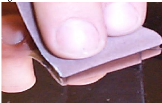
Figura 9 – Polimento em moldMAX ®

Exemplo da qualidade de polimento espelhado obtido em moldMAX ®