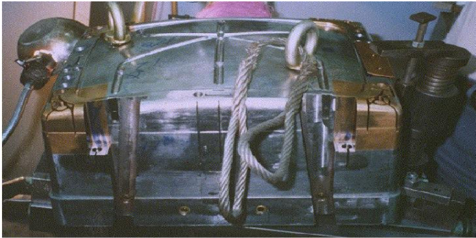
Figura 5 – Macho com detalhe de insertos.