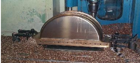
Figura 7 – Macho em usinagem. E sua peça plástica moldada por injeção.

Resultado obtido: tempo de ciclo atingido de 29 segundos, e taxa de refugo menor que 1%.