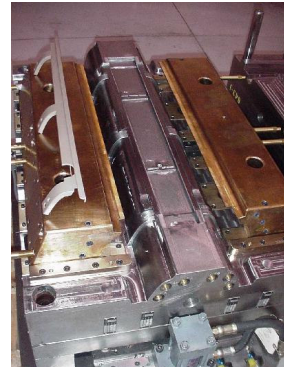
Figura 4 – Molde de peça de acabamento.