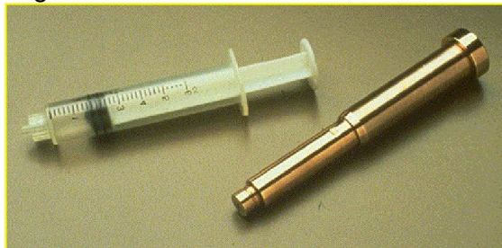
Figura 8 – Macho em moldMAX ®