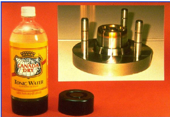
Figura 6 – Macho com detalhes de inserto.