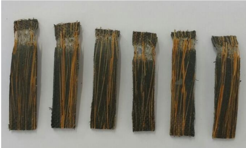
Figura 2. Vista frontal dos corpos de prova após o ensaio de tração.

Os ensaios foram realizados através da aplicação de uma força ao corpo de prova nas condições controladas. Têm-se que, geralmente, a deformação se dá em velocidade constante até a fratura. Neste caso, uma tensão máxima uniforme de 100KN foi aplicada ao longo das peças à uma velocidade de 5 mm/min. Ao final, os corpos de prova apresentaram uma deformação plástica visível nas Figuras 2 e 3.