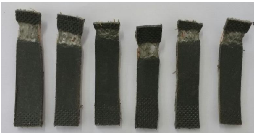
Figura 3. Vista posterior dos corpos de prova após o ensaio de tração.