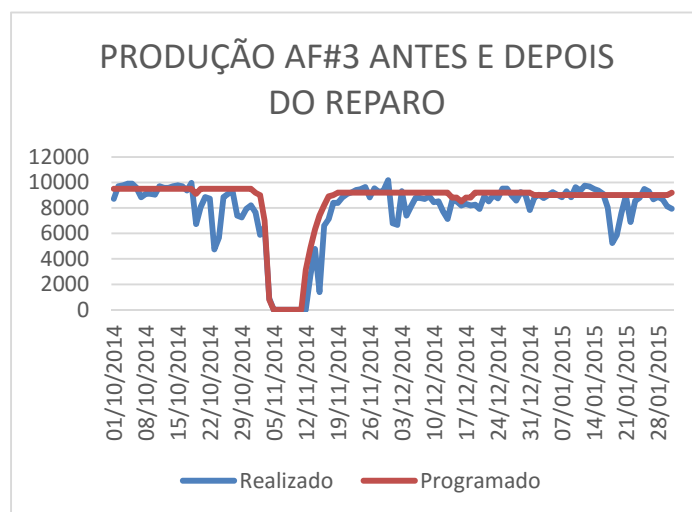
Figura 3 - Produção antes e depois da migração

Tudo isso foi realizado sem interferência na operação do AF#3, com um sucesso demonstrado na execução do projeto, pois, o AF#3 produziu o programado sem nenhuma interferência da migração do sistema, como ilustra na curva de operação antes e depois.