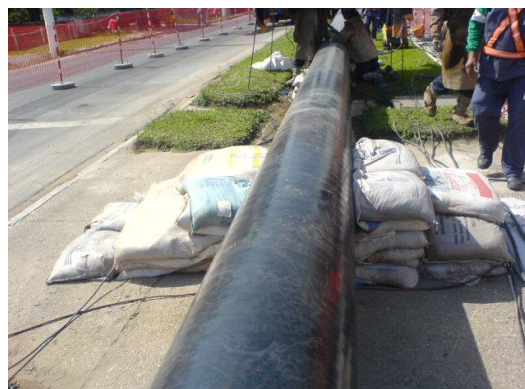
Figura 3. Acesso inadequado para pedestre.