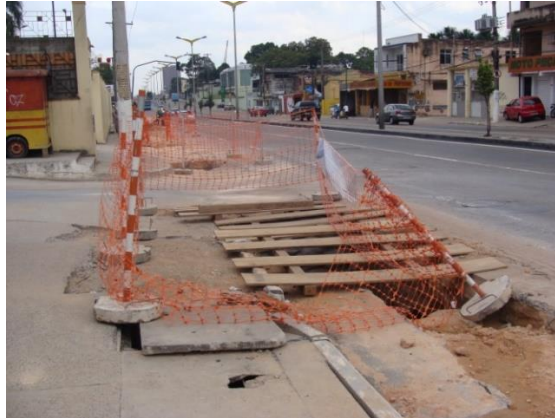
Figura 4. Sinalização inadequada.

O setor de segurança do trabalho era responsável pela colocação e manutenção de todas as sinalizações das frentes de serviços, que eram iniciadas sem o consentimento do setor, que ao chegar nessas frentes eram obrigados a improvisar com pouco material ou realizar sinalização inadequada. Ficando assim as frentes de serviços mal sinalizadas, materiais armazenados sem sinalização, aberturas de valas sem o fechamento no tempo adequado, deixando-as abertas por um longo período de tempo, colocando em risco os transeuntes.